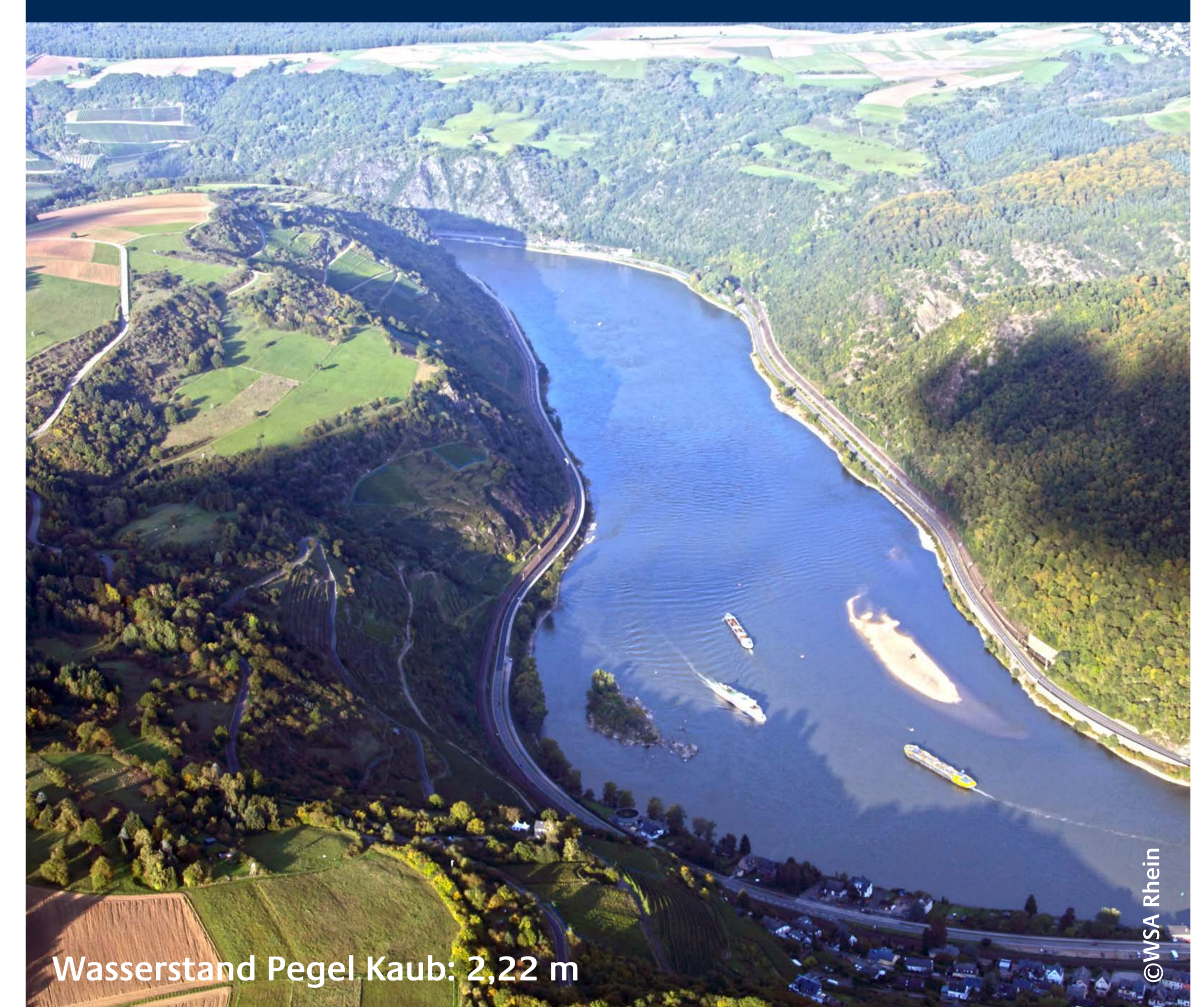
Ist-Zustand mit Visualisierung Bauwerk, Alternative 1, 2 und 3 bei Mittelwasser